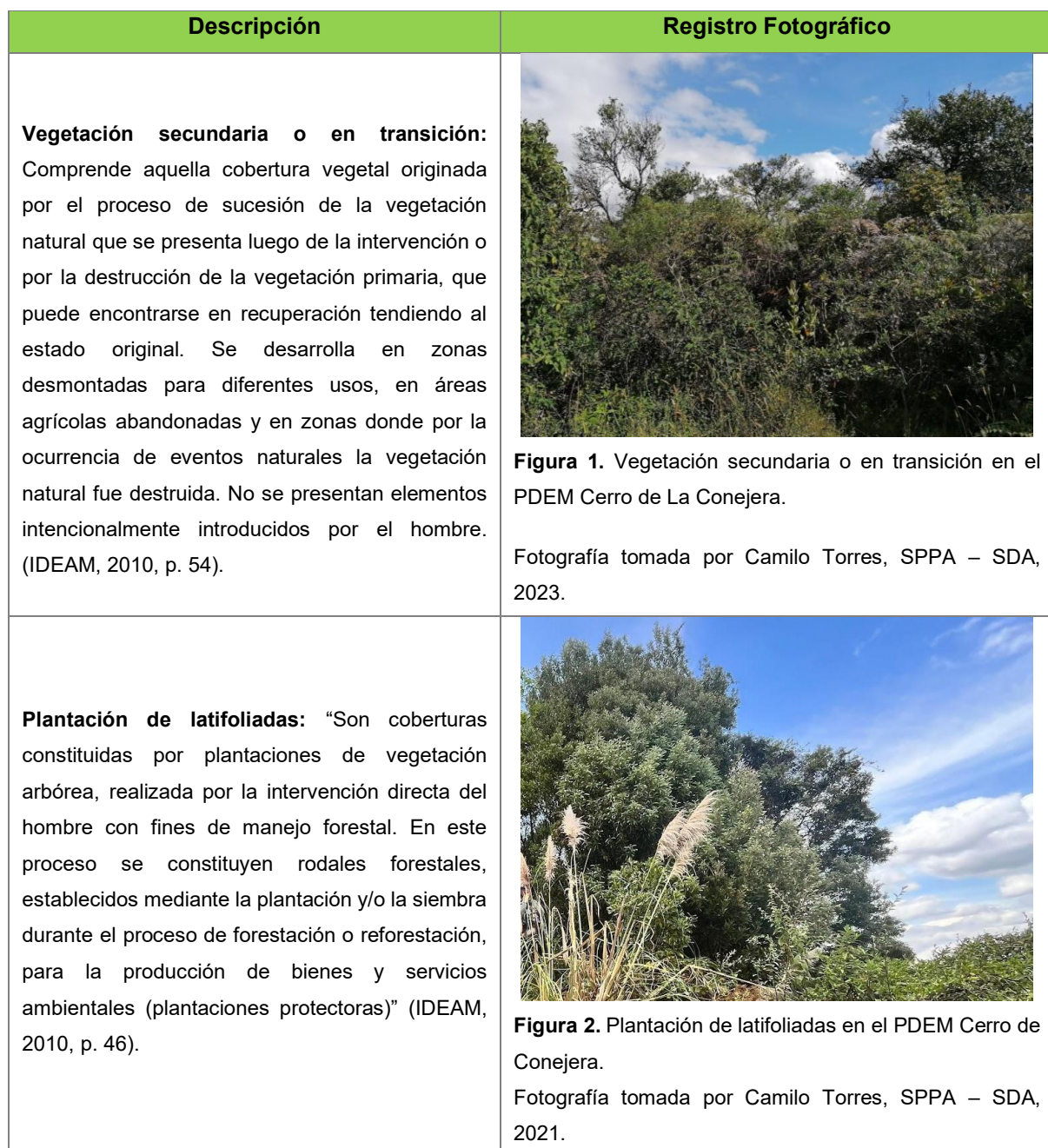
Tabla 1. Elementos de la zona de restauración del PDEM Cerro de La Conejera.

La zona de restauración está destinada para el manejo del área protegida orientado a la restauración, recuperación y rehabilitación de los ecosistemas, específicamente al control y manejo de especies vegetales enredaderas, invasoras y potencialmente invasoras, articulado con la sustitución por coberturas nativas; actividades de enriquecimiento de la estructura vegetal, mejoramiento de hábitats para la fauna, recuperación de suelos, manejo silvicultural y rehabilitación de áreas antropizadas con siembra de especies nativas, herbáceas, arbustivas y arbóreas (Tabla 1).