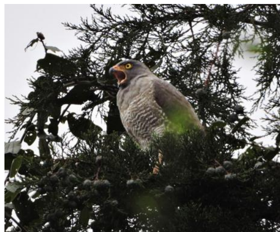
Figura 10. Gavilán caminero ( Rupornis magnirostris ).

Fotografía tomada por: Grupo Monitoreo Biodiversidad SDA. 2021. iNaturalist Colombia. Enlace de la observación: https://colombia.inaturalist.org/observations/89099744 .