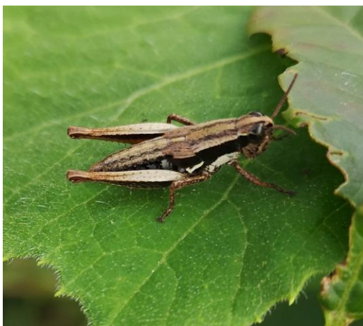
Figura 9. Saltamontes ( Bogatocris sp.).

De igual manera, la zona de restauración contiene un área de plantación forestal de eucaliptos, los cuales por su gran porte sirven de percha para aves rapaces como el Gavilán caminero ( Rupornis magnirostris ) (Figura 10) y el Gavilán aliancho ( Buteo platypterus ), pero que idealmente deberán ser reemplazadas gradualmente por especies nativas de alto porte. Adicionalmente, en esta zona se encuentra también una cobertura de pastos limpios y enmalezados, la cual se debe tener en cuenta a la hora de establecer los procesos de restauración ecológica, pues a pesar de no tener aparentemente tanto valor como un bosque, es importante para el establecimiento de invertebrados como arañas (orden Araneae) y escarabajos (orden Coleoptera), así como para el forrajeo de algunas especies de aves que prefieren las áreas abiertas.